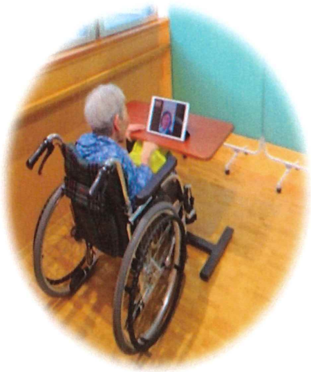
— オンライン面会のご様子 —

現在当施設ではスマートフォンアプリLINEにて、オンライン面会をお受けしております。ご利用は事前にお電話にてご予約のうえ、平日の14時〜16時までの間で10分程度の面会が可能です。ご利用お待ちしております。