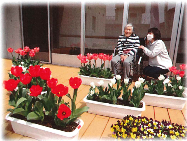
— 中庭ウッドデッキにて —

ご利用者様・職員一同、園児の皆さんにお会いできる日を心待ちにしております。ありがとうございます。