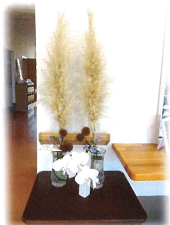
事務所受付に季節のお花を飾っております