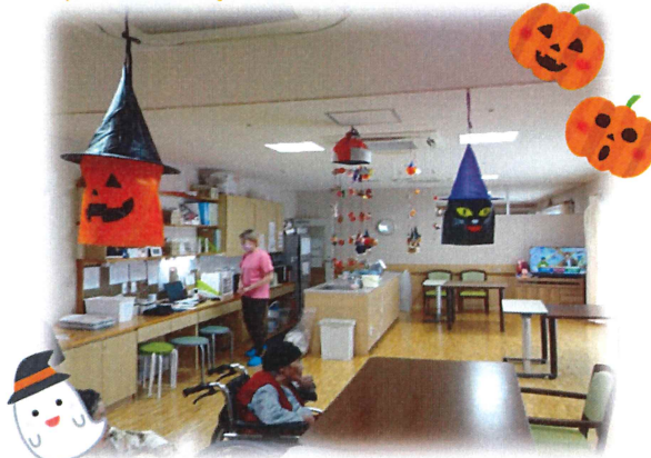
食堂にハロウィンの飾りつけを致しました