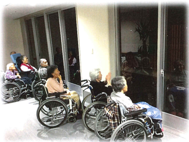
10月に行われました神栖市花火大会を施設3Fよりご覧いただきました

接種料金はお住いの市町村とご年齢によって異なり、12月発送の11月分請求書にてご請求させていただきます。