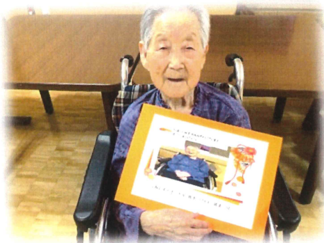
6月にお誕生日を迎えられました。おめでとうございます。