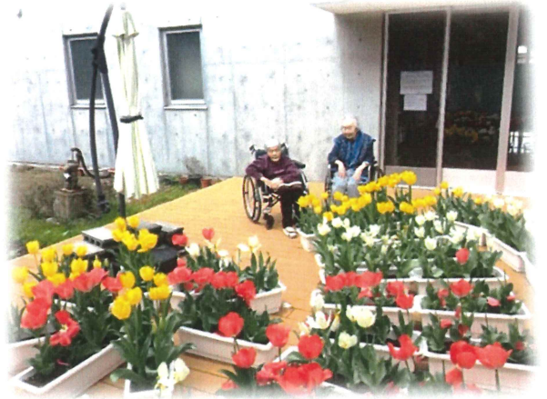
笹川中央保育園様よりチューリップを頂戴しました。