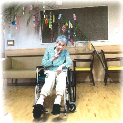
短冊にご記入していただき、笹に飾り付けを致しました。