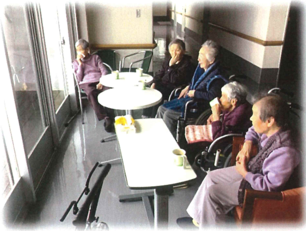
黒部川・利根川を望み、みなさまで一息。

職員に関しましては、3月に1名、4月に5名、6月に1名の陽性者が確認されました。