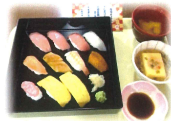
3月1日に寿司キャラバンを実施致しました。