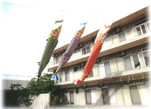
今年も中庭に鯉のぼりを飾りました。